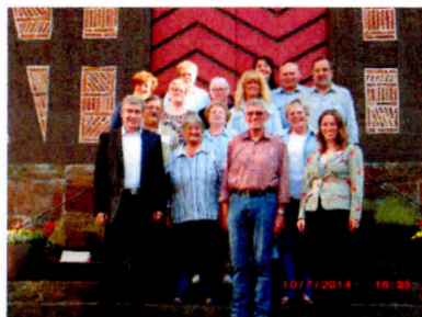
Der Seniorenbeirat mit Herrn Bürgermeister Rüdiger Heß

Der Seniorenbeirat setzt sich aus je einem gewählten Vertreter der Seniorenclubs der Kernstadt und der Stadtteile, der Kirchen, der Stiftung Hospital St. Elisabeth, des Seniorenzentrums Ederbergland, des DRK und den im Parlament vertretenen Parteien und Wählergruppen zusammen.